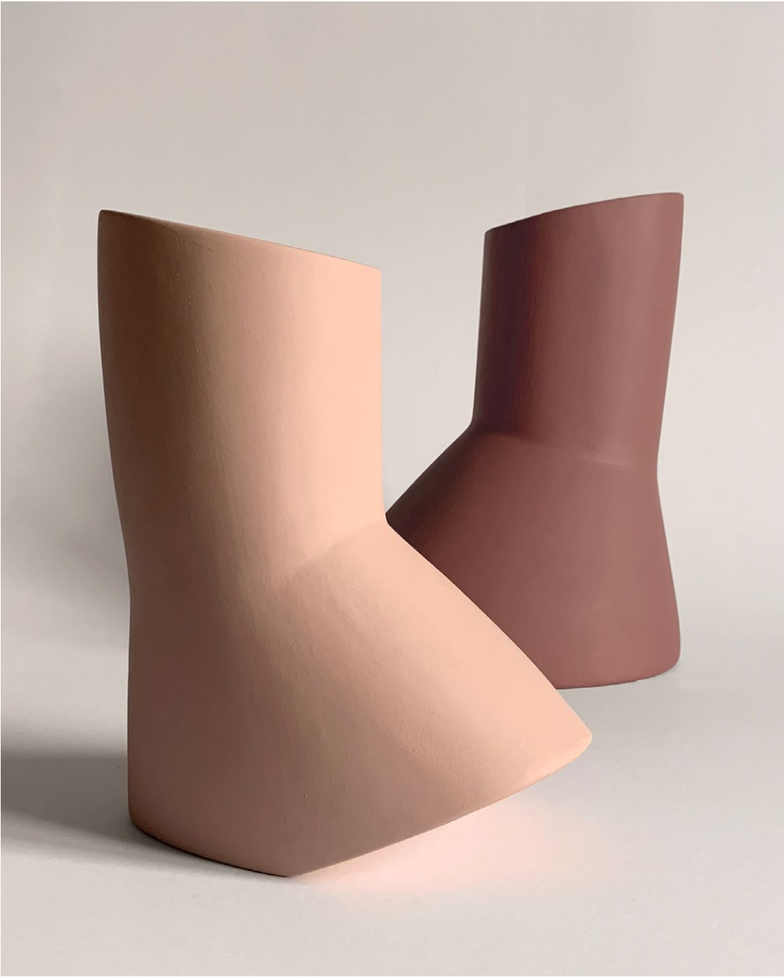
Colors in order from left Colori in ordine da sinistra: peach - toasted coffee