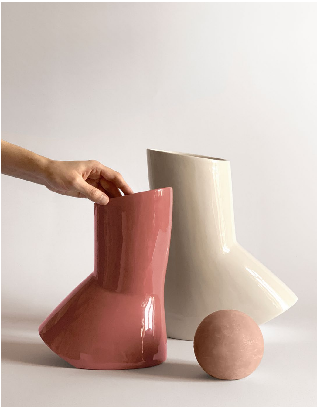
Colors in order from left / Colori in ordine da sinistra: cinnamon - ivory