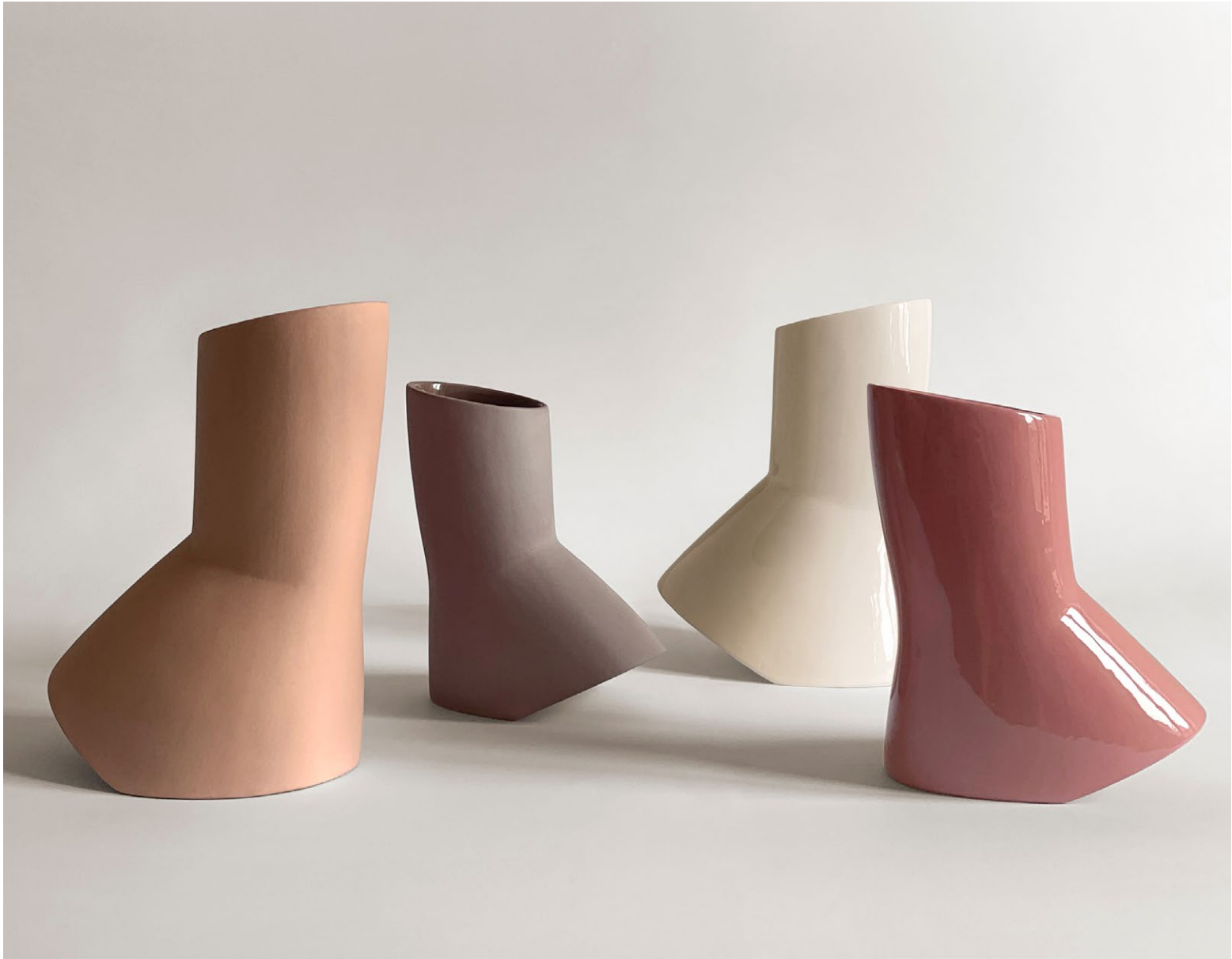
Colors in order from left / Colori in ordine da sinistra : peach - chestnut - ivory - cinnamon