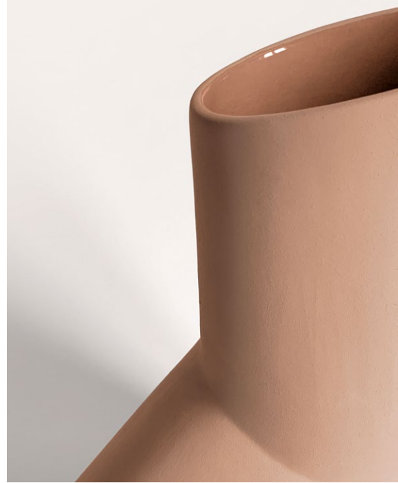
Detail of the double finishes in peach colour Dettaglio della doppia finitura nel colore peach